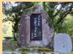
内田百閒歌碑(三谷公園)

内田百閒は幼い頃、祖母に連れられて三谷金剛童子へお参りに来ました。代表作「阿房列車」に掲載された「曲がった鉄橋」をはじめ、百閒の歩いた道を探してみませんか？ また、かつての船着き場や、船頭道が見える蕁菰社など見所満載のコースです！